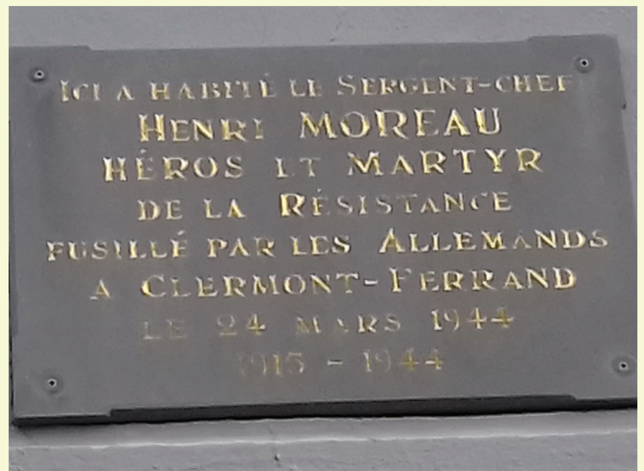
Vichy, 4 rue des Vosges, plaque apposée le 28 octobre 1945