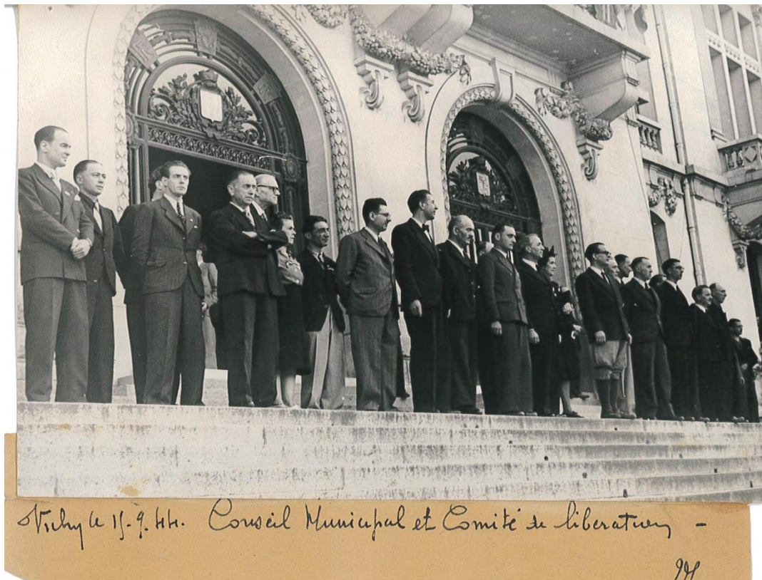
Le Conseil municipal de Vichy et le comité local de Libération sur le perron de l'hôtel de ville, le 15 septembre 1944.

C'est à ces nouvelles autorités, issues de la résistance, mais sans légitimité électorale, unies par le souvenir commun de la lutte contre l'occupant, mais très vite séparées par des conceptions différentes de l'avenir, de l'organisation des pouvoirs publics, par des visions divergentes en ce qui concerne notamment l'épuration, que revient la responsabilité de définir une politique mémorielle, d'élaborer un récit commun qui donnerait vis-à-vis de l'extérieur une image de Vichy dissociant la ville du régime qui y avait été installé en 1940. L'on sait comment les pouvoirs municipaux s'engagèrent dès l'automne 1944 dans une stratégie de défense de l'image de leur ville, en la présentant à la fois comme héroïque et martyre, et en s'insurgeant systématiquement contre des assimilations jugées dévalorisantes. Sans grand succès, nous le savons. Cet insuccès ne serait-il pas dû, en partie, à une libération de la ville dans laquelle finalement les Vichyssois ont eu peu de part et dont ils ne furent guère acteurs, se privant ainsi de toute possibilité de construire un récit héroïque crédible qui aurait pu contrebalancer efficacement les images négatives associées durablement (et sans aucun doute injustement) à la ville ?