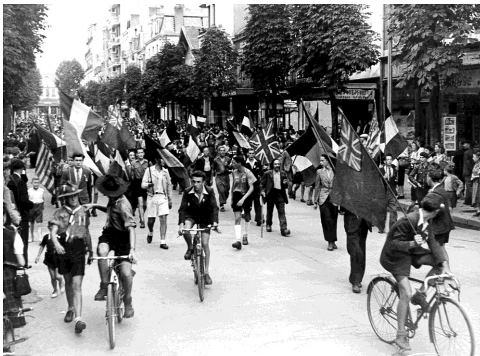
La foule en liesse défile dans les rues de Vichy 26 août 1944.

La ville est donc vidée des occupants et de leurs complices au matin du 26 août 1944. Le seul pouvoir qui demeure est le pouvoir municipal, fragilisé par quatre années de cohabitation avec le gouvernement de l'Etat Français. Ce vide politique ne peut évidemment durer ; il faut instaurer dans la ville un pouvoir provisoire ; ce ne peut être fait que par les résistants présents sur place, c'est-à-dire par des militaires entrés en dissidence, des gardes et des policiers ralliés de fraîche date, ou par des maquisards proches de Vichy, mais venus essentiellement de l'ORA ou de groupements modérés, c'est-à-dire des vichysto-résistants, selon un terme qui n'avait pas cours à cette date.