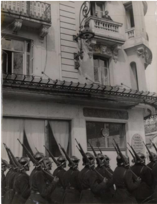
14 avril 1944 ; depuis le balcon du 2 e étage de de l'hôtel du Parc, Pierre Laval salue le GMR Bourbonnais, auquel viennent d'être remises les aiguillettes d'or.